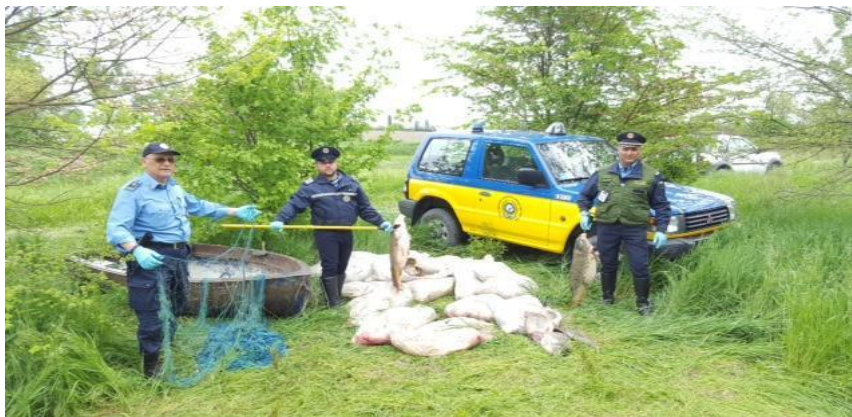
Figura 10 Mentre i braccianti dediti alla cattura materiale del pesce mediante reti e elettricità attendono il trasportatore responsabile della consegna del pescato al centro di stoccaggio e lavorazione Polizia Provinciale e Guardie Giurate Volontarie li colgono sul fatto.

La filiera dell'illegalità inizia così a delinearsi. Non si tratta unicamente di condotte afferenti la pesca di frodo, ma si tracciano i profili di un'organizzazione più complessa, dedicata all'intera filiera illegale del commercio del pescato di acque interne catturato in Italia, sia verso i mercati nostrani che quelli esteri. Dal 2012, l'organizzazione di mezzi e di persone si è sviluppata e negli anni ha accresciuto le proprie fila ed il proprio profitto, senza subire particolari battute di arresto, almeno fino al 2018 – 2019.