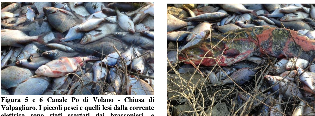
Figura 5 e 6 Canale Po di Volano - Chiusa di Valpagliaro. I piccoli pesci e quelli lesi dalla corrente elettrica sono stati scartati dai bracconieri, e abbandonati sulla sponda. Peso complessivo del pescato scartato: 3 quintali.

L'elettrostorditore è un congegno apparentemente semplice, quanto distruttivo. Nelle indagini svolte dalla Polizia Giudiziaria ne sono stati rinvenuti diversi tipi, tutti autocostruiti dagli stessi bracconieri. Si tratta di una pertica di metallo collegata a batterie e potenziometri, in grado di scaricare elettricità mediante impulsi direttamente nelle acque, uccidendo sul colpo o stordendo pesantemente le forme di vita comprese nel suo raggio d'azione.