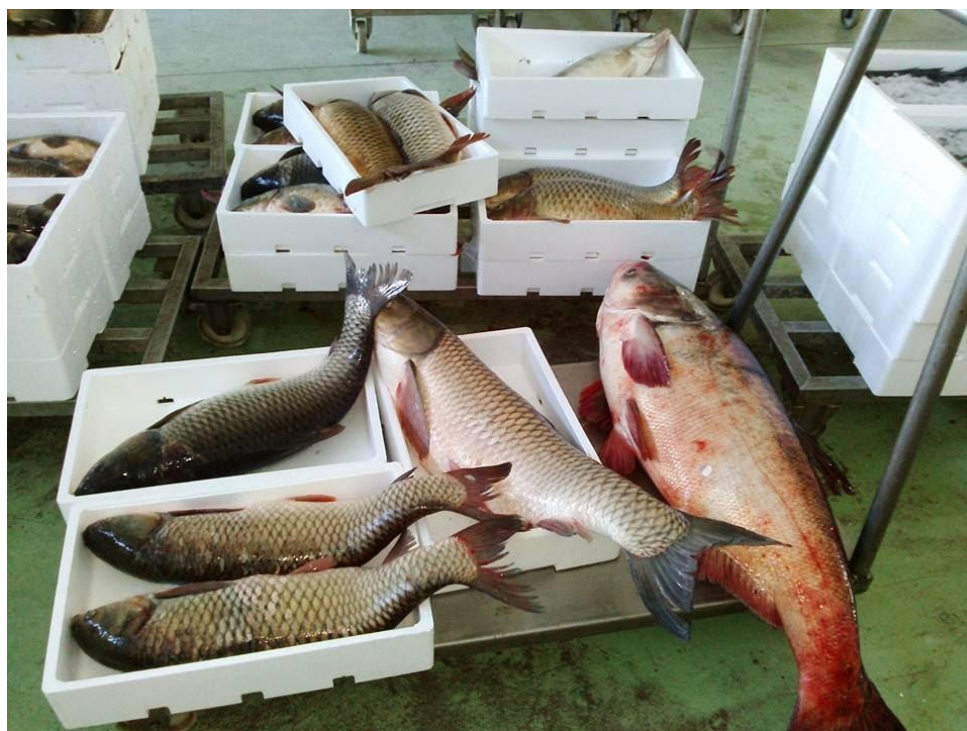
Figura 12 Foto del mercato ittico di Donada (RO) - 2017. Prima del 2012 era prossimo alla chiusura per via della concorrenza con gli altri mercati più importanti della costa rivierasca, negli anni successivi si è affermato come uno dei principali mercati ittici per pescato d'acque interne nel Nord Est del paese.

Si evidenzia come dal 2012 in poi, nei registri conservati presso i mercati ittici locali vi sia stato un repentino aumento dei conferimenti e delle vendite di specie ittiche che, storicamente in Italia, non hanno mai rivestito particolare interesse nei consumatori. Si tratta di carpe, carpe erbivore, siluri, temoli russi, breme, carassio tutte specie di origine danubiana, poco conosciute e sicuramente poco consumate nella nostra cucina tradizionale. Negli anni, non solo per gli immigrati dell'Est Europa che si sono trasferiti in territorio italiano, ma soprattutto per l'affermazione di un mercato europeo di libera circolazione di beni e persone, la domanda di tali prodotti ittici provenienti da acque interne è cresciuta esponenzialmente ed i mercati si sono adattati di conseguenza, tanto che in pochi anni le specie danubiane sono diventate quelle maggiormente commercializzate. I mercati che prima erano prossimi alla chiusura si sono improvvisamente ripresi, ampliando l'offerta di quelle specie ittiche provenienti dalle acque interne, anche se pure a questo punto si dovrebbe porre una seria riflessione su quanto si è derogato ai controlli sulla qualità di tali prodotti destinati all'alimentazione umana a vantaggio del facile e veloce profitto.