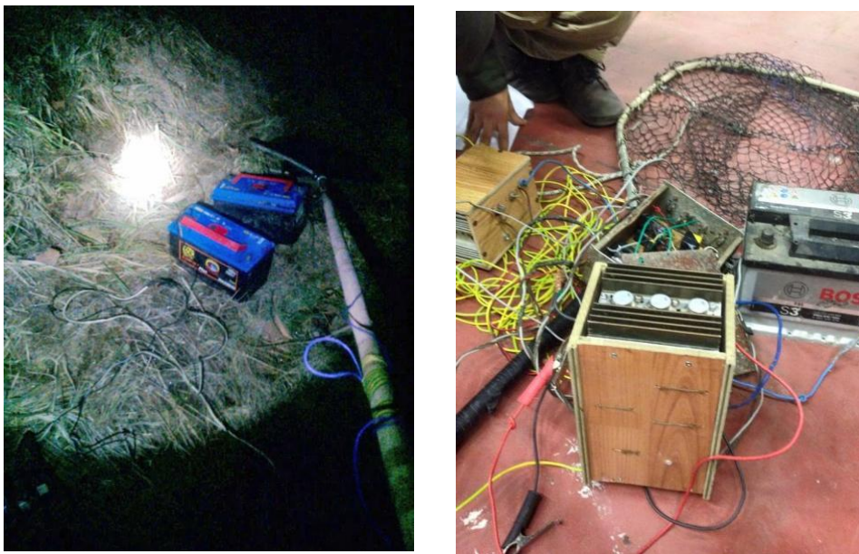
Figura 4 Particolari dell'elettrostorditore.

vera e propria attività di pesca di frodo di stampo industriale, attuata con strumenti vietati ad elevata capacità di cattura e particolarmente distruttivi per la fauna ittica. Non si discute inoltre sul fatto che tale attività produca enormi danni ambientali. Analizziamo ora gli strumenti, le tecniche e le modalità di condotta che tali pescatori di frodo adottano per catturare, lavorare e immettere tali prodotti illeciti sul mercato.