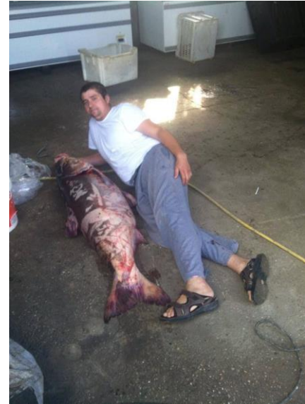
Figura 8 Reperita sui social network, pubblicata dallo stesso pescatore di frodo per testimoniare la grandezza della preda, anch'essa illecitamente conservata

La filiera dell'illegalità inizia così a delinearsi. Non si tratta unicamente di condotte afferenti la pesca di frodo, ma si tracciano i profili di un'organizzazione più complessa, dedicata all'intera filiera illegale del commercio del pescato di acque interne catturato in Italia, sia verso i mercati nostrani che quelli esteri. Dal 2012, l'organizzazione di mezzi e di persone si è sviluppata e negli anni ha accresciuto le proprie fila ed il proprio profitto, senza subire particolari battute di arresto, almeno fino al 2018 – 2019.