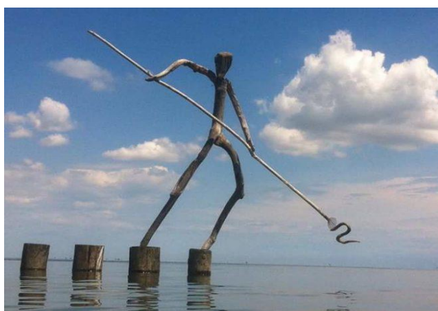
Figura 1 Il fiocinino - Scultura di Enrico Menegatti, Lido di Volano

Il fenomeno della pesca illegale è storicamente conosciuto dal nostro ordinamento e dalla cultura tradizionale della prima metà del '900. 1 Fino al primo dopoguerra, sull'asse del fiume Po e nelle sue zone vallive, la pesca di frodo rappresentava un vero e proprio mezzo di sussistenza delle famiglie più umili e svantaggiate. Nel ferrarese, tipici del comune di Comacchio erano i tradizionali “fiocinini”, folcloricamente denominati “pirati del fiume” o “di valle”. Erano pescatori illegali di anguille che, introducendosi negli allevamenti ittici privati o esercitando la pesca professionale senza licenza autorizzativa, erano noti alle corti e alle cronache locali per catturare, di notte con le proprie fiocine, le prede. 2 Il bracconaggio ittico dell'epoca era un fenomeno poco diffuso, localizzato in alcune aree geografiche specifiche, legato alle classi meno abbienti, e che perciò non era percepito come emergenziale. Le sanzioni previste per le condotte di bracconaggio ittico erano perciò motivate principalmente dal dover prevenire i danni patrimoniali realizzati alle attività di pesca, legate al settore primario dell'economia e reprimere le condotte di reato loro lesive.