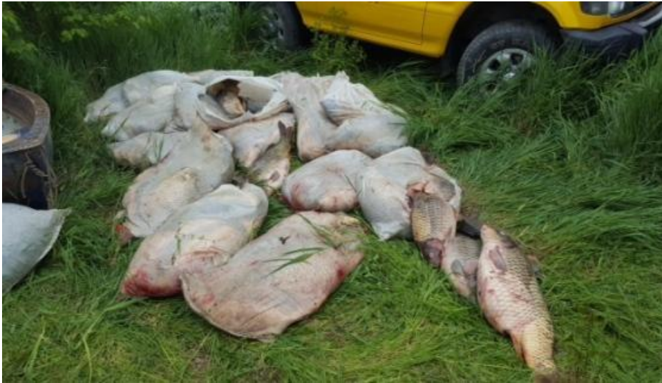
Figura 11 Particolare del pescato, stoccato e conservato in violazione della legge.

Difficile comprendere come questi prodotti, illecitamente catturati, che sono trasportati, stoccati e lavorati in condizioni non idonee e vietate dalla legge, finiscano poi all'interno dei mercati nostrani, riuscendo ad evitare quei controlli sulla qualità che dovrebbero negare loro la possibilità di essere commercializzati, almeno per uso umano. Ciò invece non accade, od accade molto raramente. Tale fatto dovrebbe suggerire una riflessione più approfondita sulle modalità di controllo all'entrata dei prodotti che vengono commercializzati sui banchi alimentari italiani, il pescato in questione, quello illecitamente catturato con tecniche vietate, è soggetto ad autocertificazione realizzata direttamente dal pescatore che ne ha preso possesso, è lui stesso che certifica le modalità, il luogo e l'orario in cui ha esercitato la sua azione di pesca. Appare chiaro come, per chi realizza pesca di frodo, sia facile eludere la legge, autocertificando il falso. In ogni caso, per essere commercializzato, il pesce passa obbligatoriamente per i mercati ittici, e una volta entrato nella filiera, a prescindere dalle modalità di pesca vietate dalla legge con cui è stato catturato, è considerato a tutti gli effetti un prodotto alimentare commercializzabile e destinato al consumo umano. Così si chiude il procedimento di regolarizzazione di un prodotto che mai dovrebbe entrare nella filiera alimentare.