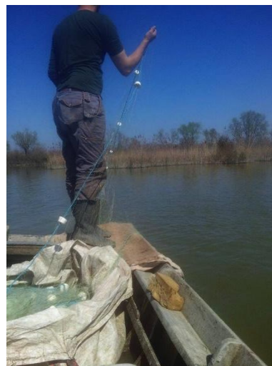
Figura 7 Attività di pesca di frodo

Per ciò che concerne le modalità di trasporto, stoccaggio, lavorazione e distribuzione dei prodotti derivanti dalla pesca illegale, sempre grazie all'operato della Polizia Giudiziaria, che in tali indagini ha avuto ruoli fondamentali che poi osserveremo meglio nel dettaglio, è stato possibile risalire ad una complessa filiera dell'illegalità che muoveva i propri contatti in tutta Europa.