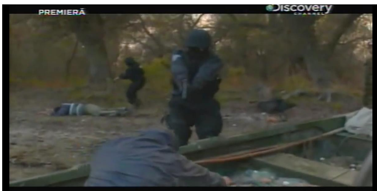
Figura 2 Operazione SAS Tulcea in contrasto al bracconaggio ittico

professionale 10 , tali cittadini europei provenivano prevalentemente dalla provincia di Tulcea, una città sita sul delta del Danubio. L'emigrazione di queste bande di pescatori, costituite prevalentemente da nuclei familiari numerosi, è stata determinata dalle dure politiche di repressione messe in atto negli ultimi anni proprio dalla Romania, la quale, a fronte di un depauperamento di oltre l'80% della risorsa ittica del Parco del Delta del Danubio - Patrimonio Unesco 11 , ha provveduto ad inasprire le norme penali volte alla tutela del patrimonio ambientale, nonché a destinare 10 diversi reparti di forze dell'ordine a tale competenza, compreso un corpo formato e dedicato specificatamente al solo contrasto del bracconaggio, denominato SAS Tulcea 12 .