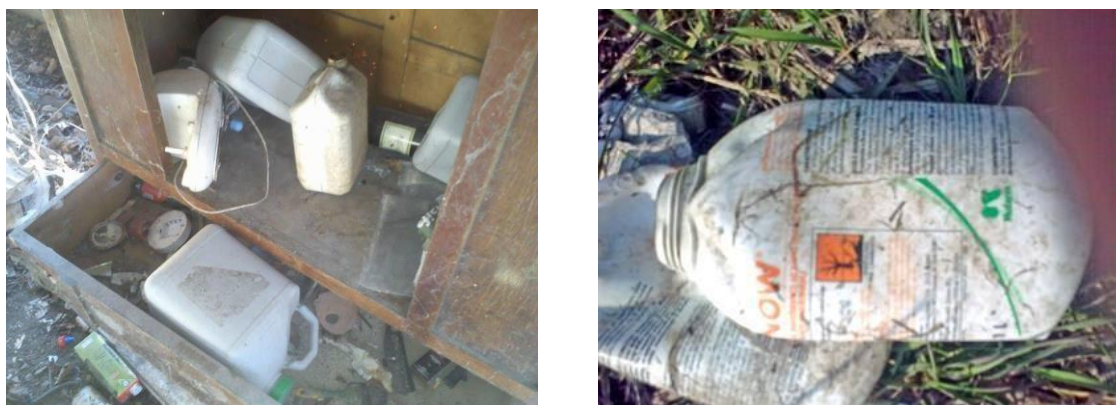
Figura 6 Veleni agricoli, fertilizzanti e anticrittogamici utilizzati per stordire ed uccidere la fauna ittica, per poi venderla come prodotto alimentare.

Anche in questo caso le numerose indagini della Polizia Giudiziaria hanno condotto al ritrovamento frequente di tali prodotti pericolosi.