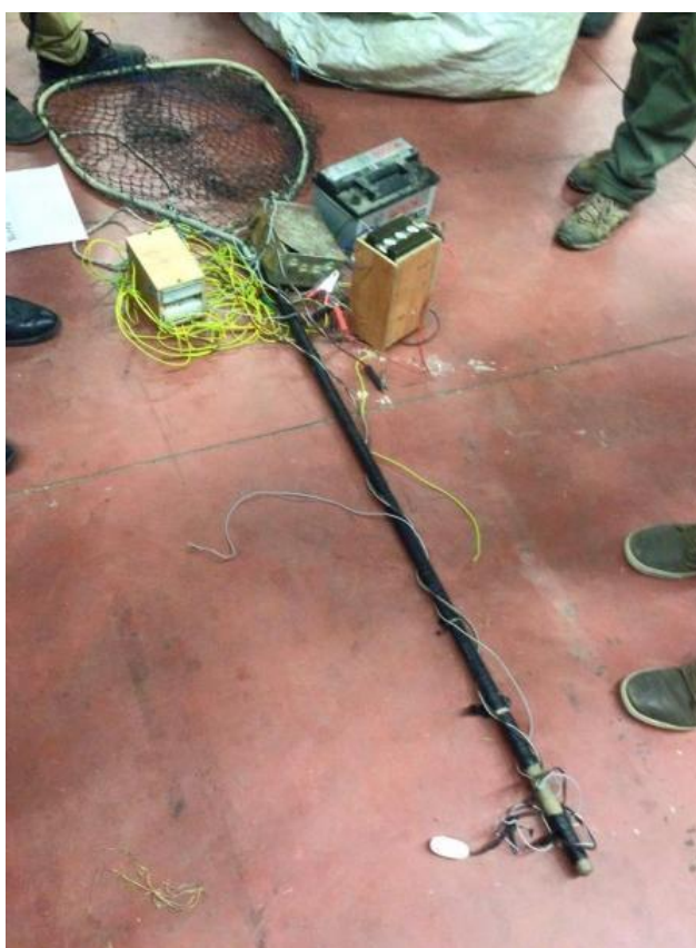
Figura 3 Particolare di elettrostorditore.

I lipoveni sono una popolazione nomade di origine Russa che vive storicamente delle risorse del fiume, ma culturalmente non sembra possiedano quei valori di rispetto e tutela ambientale riscontrabili solitamente in chi trae dall'ambiente le risorse per il proprio sostentamento. A confermare ciò sono i metodi illegali che i bracconieri utilizzano durante le loro azioni. Essi praticano la pesca con l'elettrostorditore, un congegno distruttivo ed ad elevata capacità di cattura, di facile realizzazione e che permette di uccidere, stordire o mettere in fuga il pesce per mezzo di scariche elettriche. Nel 2014, nel Canale Circondariale di Ostellato - FE, è stata sequestrata una rete della lunghezza di 4 km, e liberata oltre una tonnellata di pesce. 13 Le loro tecniche variano molto a seconda dell'ambiente in cui operano: nei canali meno profondi con grandi quantità di canneto, o nei cd. sottobotte 14 , utilizzano addirittura veleni e fertilizzanti agricoli pur di stordire il pesce, metterlo in fuga e catturarlo. La condotta di bracconaggio ittico singolarmente considerata e descritta poco sopra non esaurisce di per sé la filiera illegale che in pochi anni si è strutturata sul territorio italiano e che, per organizzazione e pluralità di condotte delittuose, assume le caratteristiche dell'associazione per delinquere ex art. 416 c.p. e di cui mi occuperò nei capitoli successivi.