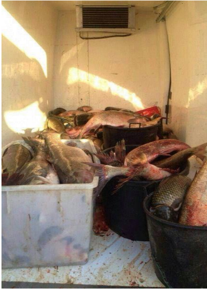
Figura 9 Relativa ad un sequestro di prodotti illecitamente pescati e trasportati;

contenitori inadatti, non monouso, in uno spazio che viola le norme igienico sanitarie che regolano il settore.